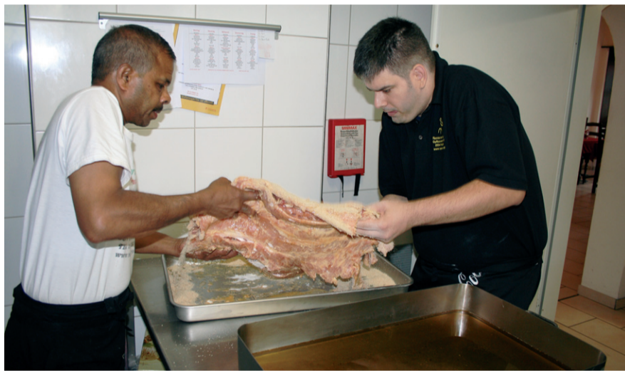
Volle Konzentration bei der Zubereitung in der Küche